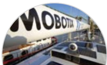
Siglin í kringum heiminn - tvisvar - bls 2